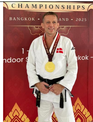
Boe Byvard 6. Dan Jiu Jitsu